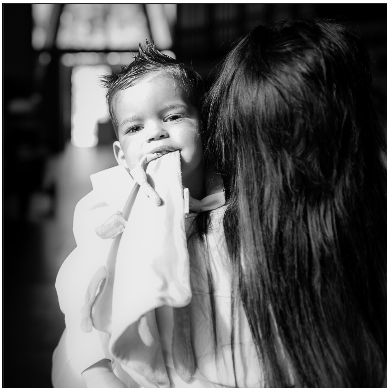
Les qualités naturelles du Val-de-Travers dans leur dimension humaine (01/24)

Le Conseil communal invite dès lors les écoles de Fleurier et la population à découvrir cette nouvelle prestation, tout en soulignant qu'il maintient son soutien à la bibliothèque de Fleurier dont les horaires restent inchangés. Des réflexions pour en faire un site fixe du Bibliobus sont par ailleurs en cours.